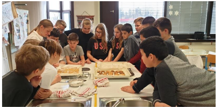
Slika 3: Pomoč pri dnevu dejavnosti