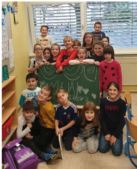
Slika 4: Učenci v OPB 2. C

Po osmih mesecih mi je šola zagotovila še sedem mesecev pedagoškega dela v oddelku podaljšanega bivanja, kjer sem se preizkusila v vlogi učiteljice OPB 2. razreda.