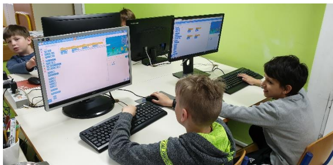
Slika 1: Učenci pri uri računalništva.